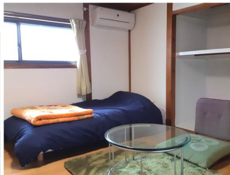
2F Room 【ゆず】