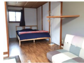
2F Room 【さくら】