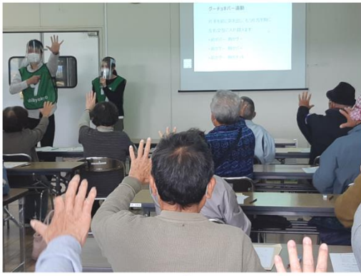
グーチョキパー運動