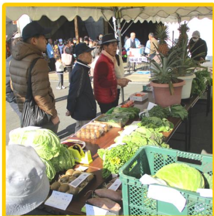
27回 なかるく・にぎわい 秋まつり