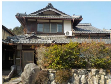
↑ 口田野 ↓